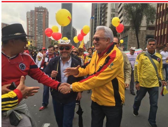
Fotos Marcha 2 de Abril