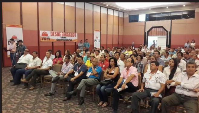
Taller Construyendo País ▲ Girardot 13 de febrero de 2016