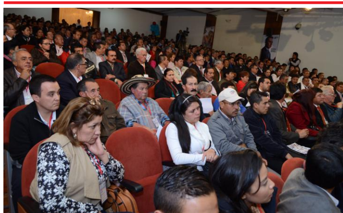
Convención Departamental Centro Democrático