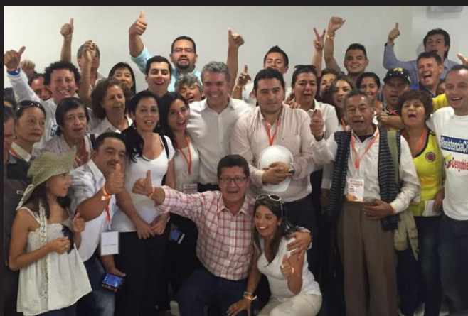
Taller Construyendo País ▲ Fusagasugá 11 de junio de 2016

Se espera poder recorrer gran parte de los municipios del departamento de Cundinamarca, y del país, buscando además la participación no solo de militantes del Centro Democrático, sino de todos aquellos que quieran aportar sus ideas, pues únicamente de esta manera, y con la participación de todos los ciudadanos se logrará cambiar el rumbo del país.