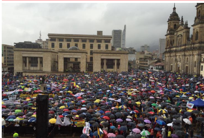
Fotos Marcha 2 de Abril