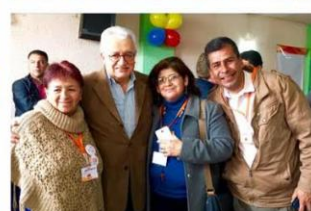
► Taller Construyendo País Soacha 30 de abril de 2016