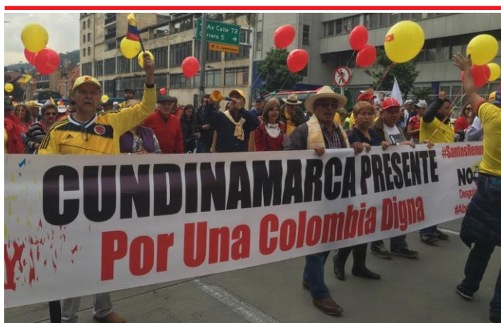
Fotos Marcha 2 de Abril