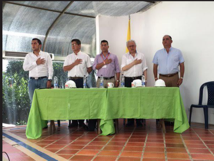
Taller Construyendo País ▲ La Mesa 23 de abril de 2016