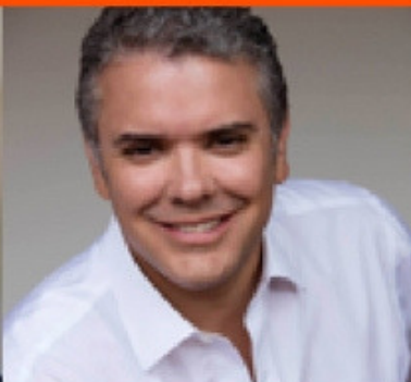
H.S Iván Duque